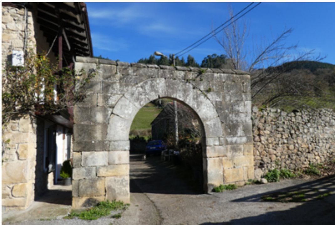
Arco en el pueblo de San Martín, del municipio de Santiurde de Toranzo.