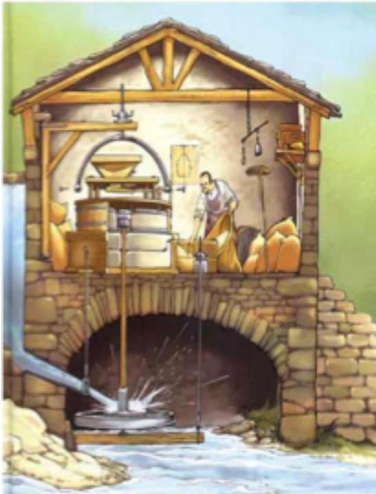
Dibujo del interior de un molino.