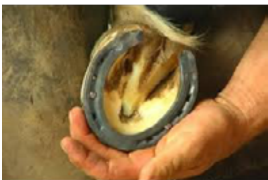
Herradura colocada en el casco de un caballo.

Herrar es ajustar y clavar herraduras a los caballos, burros o bueyes en los cascos de las patas.