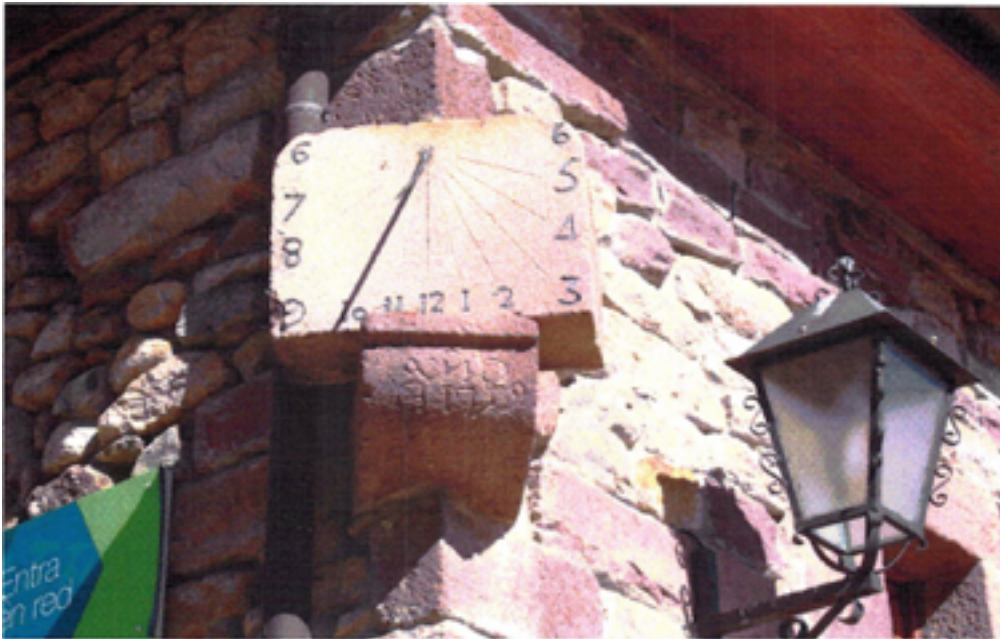
Reloj de sol en el pueblo de Pesquera, del municipio de Pesquera.