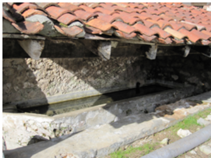
Lavadero en el pueblo de Burio, del municipio Lamasón.