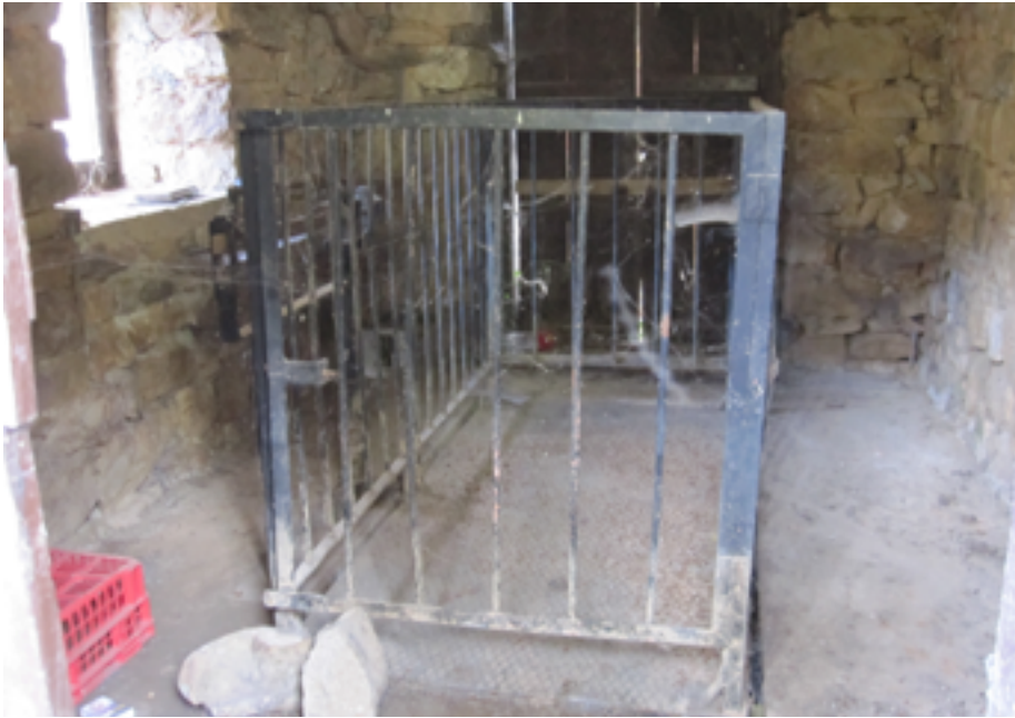
Báscula en el pueblo de Quintanilla, del municipio de Lamasón.