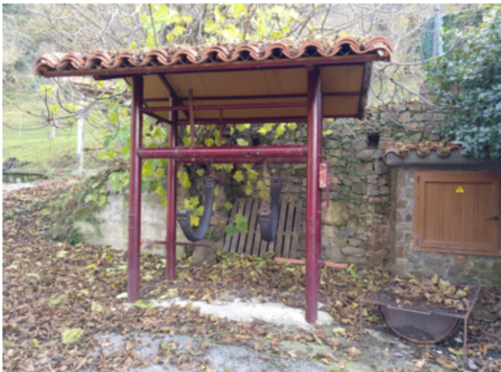
Potro de herrar en el pueblo de Tudes, del municipio de Liébana.