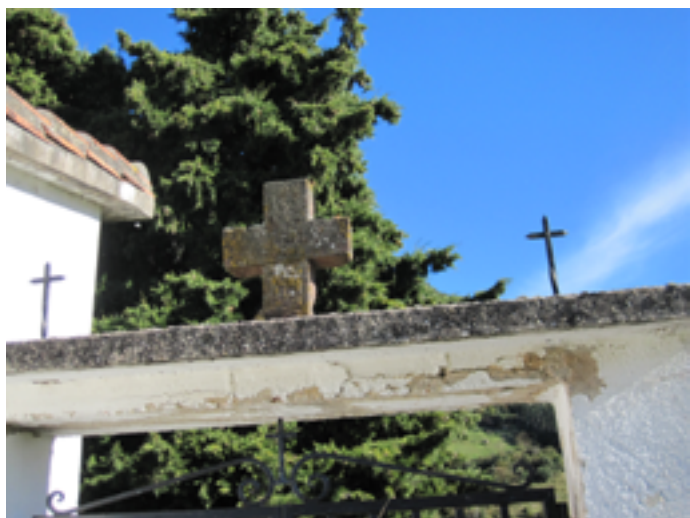
Cruz de cementerio en el pueblo de Quintanilla, del municipio Lamasón.

Fotografías de ejemplos de algunos elementos del patrimonio cultural rural material.