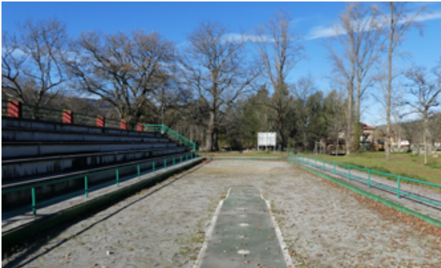
Bolera “El Carmen” en el pueblo de San Martín de Toranzo, del municipio de Santiurde de Toranzo.