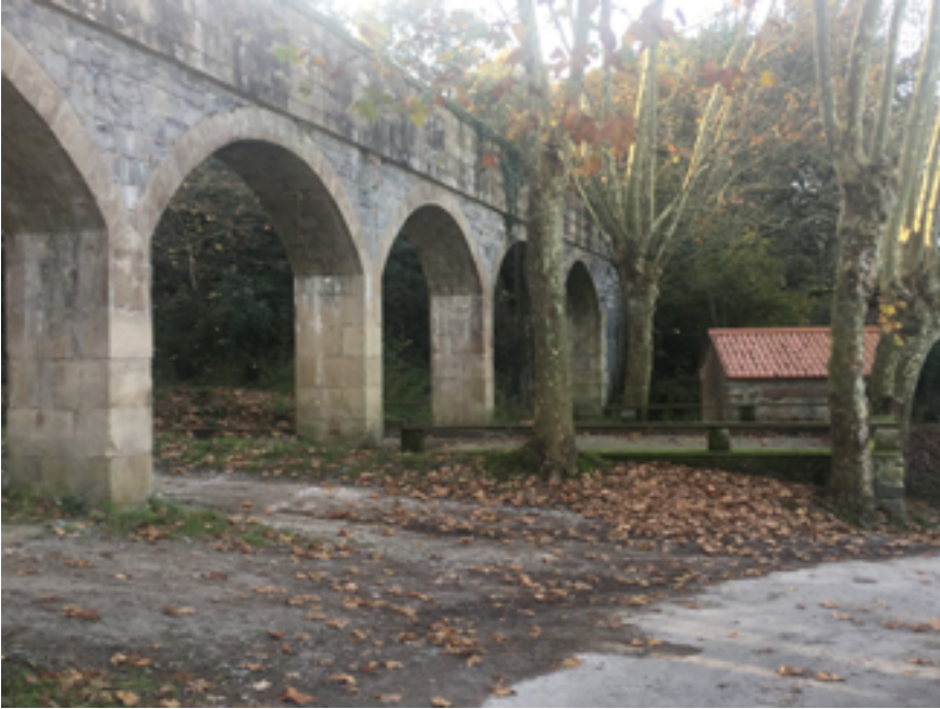
Acueducto en el pueblo de Santiurde de Toranzo, del municipio de Santiurde de Toranzo.